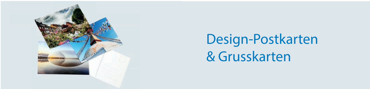
Design-Postkarten & Grusskarten